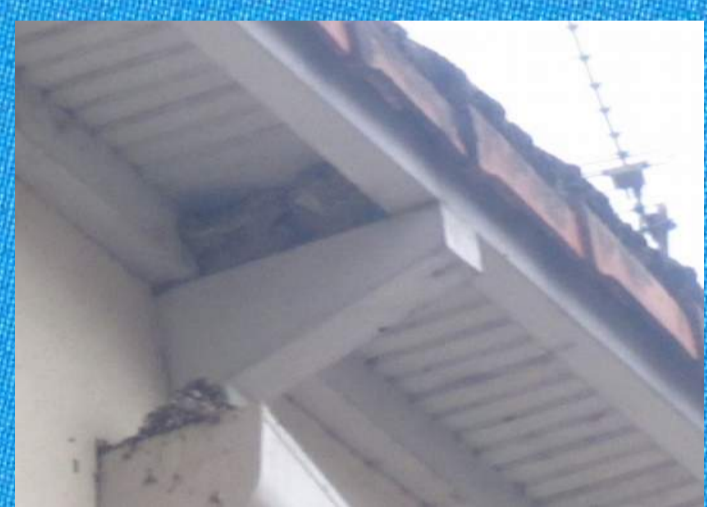
Nids d'hirondelles à Niort