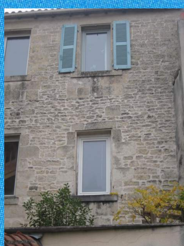
Façade rénovée à Niort