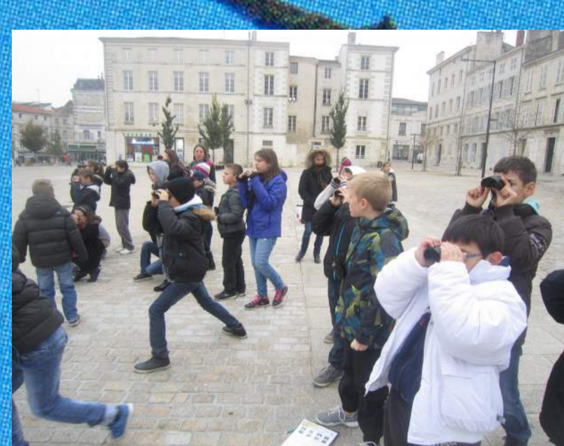
Nous essayons de voir des oiseaux à Niort