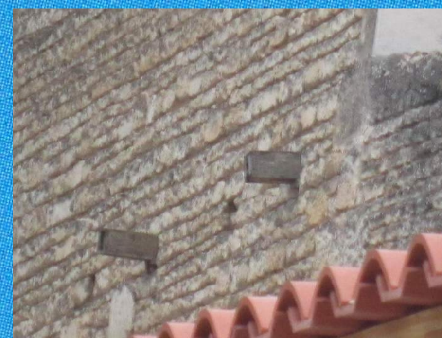
Des nichoirs pour les moineaux à Niort