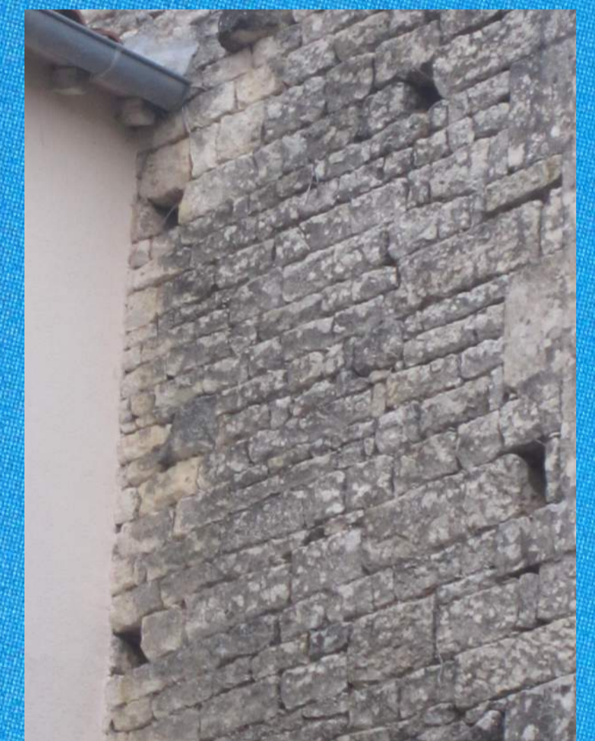
Une façade non rénovée à Niort