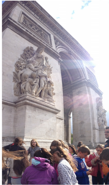
Visite de l'Arc de Triomphe

Nous avons été au pied de l'Arc de Triomphe. Après une dizaine de minutes d'attente, nous avons monté les marches jusqu'au premier étage et nous nous sommes arrêtés pour reprendre notre souffle. Nous avons continué de monter les marches. Enfin nous sommes arrivés tout en haut de l'Arc de Triomphe et nous avons admiré la ville de Paris. Nous avons vu : la tour Eiffel, la tour Montparnasse et le quartier de la Défense. Nous sommes redescendus de l'Arc de Triomphe. C'était à couper le souffle !