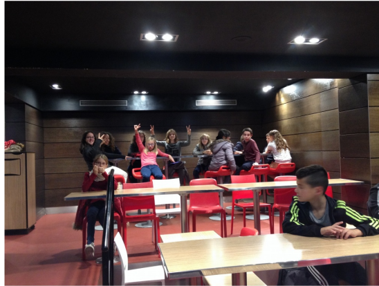
Déjeuner au Quick des Champs Élysées

Nous voici ! Notre menu est le suivant : il y a eu des frites, des hamburgers au steak haché, la boisson c'était du coca cola puis le dessert c'était 3 beignets (un au chocolat noir, le deuxième était au nutella et le dernier au chocolat blanc). On a très bien aimé le voyage à Paris. Ça nous a fait découvrir Paris en compagnie des camarades. On se connaissait mieux après.