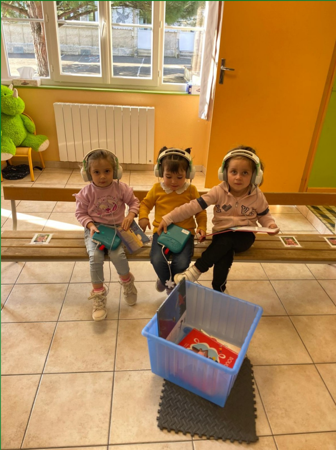
Les élèves de PS/MS écoutent les histoires mises en voix et enregistrées par les élèves de CE2/CM1.