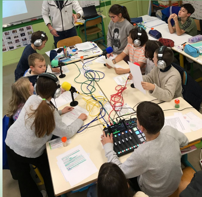
Les élèves autour de la webradio découvrent le matériel et mettent en voix leur texte : distribution des rôles, mise en son...