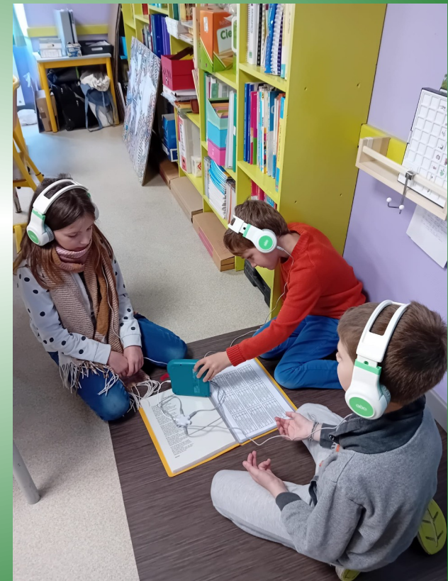
Les élèves s'enregistrent et s'écoutent sur les bookinous pour améliorer leurs pratiques.