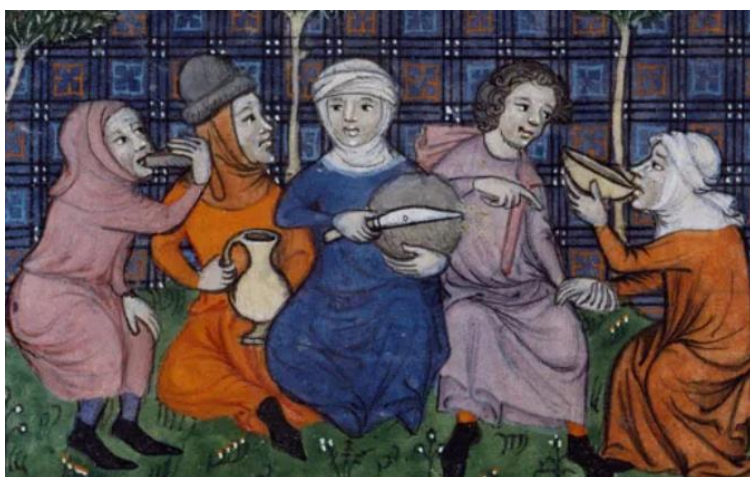
Exposition "A table au Moyen-Age" - Le partage du pain, aliment essentiel du repas paysan • Crédits : Guillaume de Machaut, Oeuvres , Paris du XIVe, Paris BnF - Tour Jean Sans Peur 20

Tu vas imaginer le dialogue entre deux personnages de cette image.