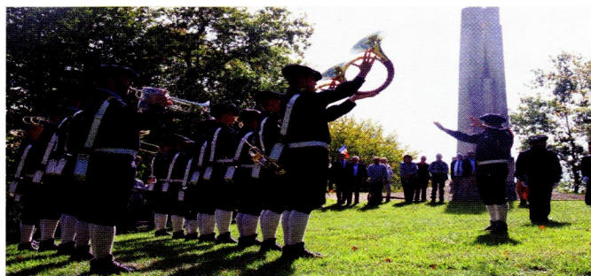
Cérémonie au monument du 27 e BCA à Braye-en-Laonnois, le 20 septembre 2015.

Braye-en-Laonnois est devenu depuis plusieurs années le village-mémoire du 27 e bataillon de chasseurs alpins. Le régiment s'est en effet battu dans la commune en 1917 et, par un triste rebond de l'histoire, en 1940, perdant de très nombreux hommes à chaque fois. Le 20 septembre 2015, la cérémonie annuelle en hommage aux chasseurs alpins a réuni une centaine de personnes autour des autorités et de la fanfare du 27 e BCA venue d'Annecy.