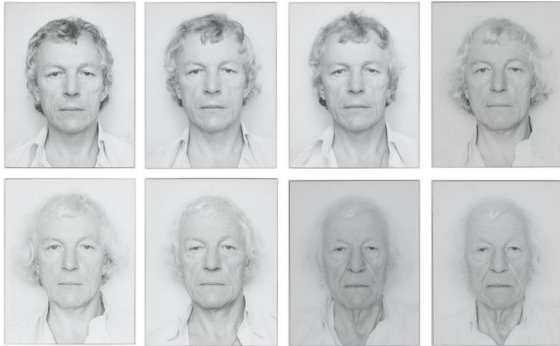
Série d'autoportraits (extraits)

En 1965, Roman Opalka a une idée qui orientera sa création durant quarante-six années. Sur des toiles de 196x135 cm, il inscrivit sans relâche la suite numérique. Les chiffres font environ 5 mm de haut, peints avec un pinceau taille 0. Il commença à peindre (le nombre 1 donc) en blanc sur fond noir et à partir de 1972, il ajouta 1 % de blanc à chaque fond de nouvelles toiles. En 2008 arriva le moment où il finit par peindre en blanc sur blanc. Il appela cela le « blanc mérité ». Parallèlement à cela, Roman Opalka se prit en photo, toujours avec le même cadre et la même pose après chaque journée de travail. À partir de 1968 il commença également à enregistrer sa voix prononçant en polonais les nombres qu'il était en train de peindre. L'œuvre de Roman Opalka aura duré 46 ans, se compose de 231 toiles, de milliers d'autoportraits et d'heures d'enregistrement. Elle s'est conclue sur le nombre 5 607 249, inscrit le jour de sa mort, le 6 août 2011.