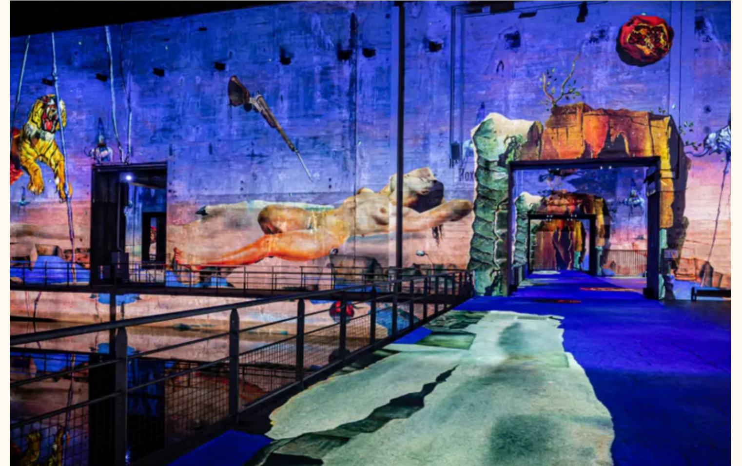
Le bassin des lumières à Bordeaux