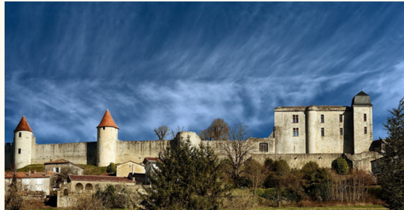
Le chateau de Villebois Lavalette