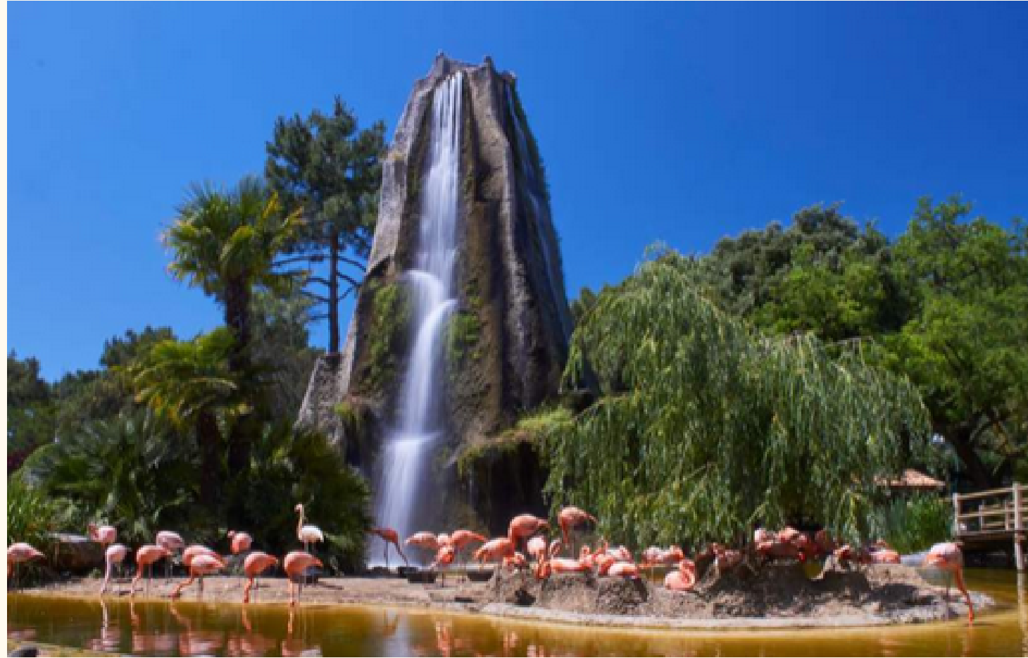
Le zoo de La Palmyre