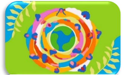
Burcu Köleli pour ONU Femmes (2022)

Des ressources sur le blog de la circonscription en cliquant sur le lien Egalité F/G ainsi qu'une ressource en anglais : lien