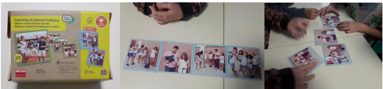
Ecole primaire d'Aunac-sur-Charente (16)

La boîte contient 5 séquences de 4 cartes à observer et ordonner.