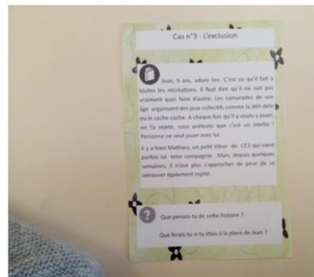
Ecole primaire de Marols (42)