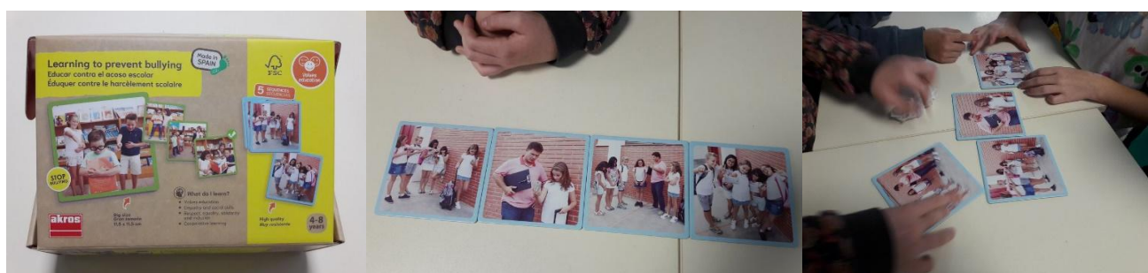
Ecole primaire d'Aunac-sur-Charente (16)

La boîte contient 5 séquences de 4 cartes à observer et ordonner.