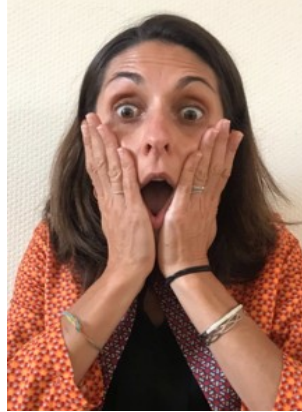
Travail sur le cri de Munch

Enfin, j'affectionne le fait de créer des projets divers et variés (classe, école, partenaires extérieurs) et les voir aboutir.