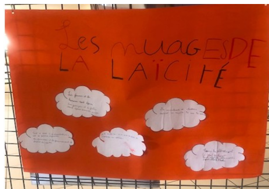
Affiches de Vicor Hugo