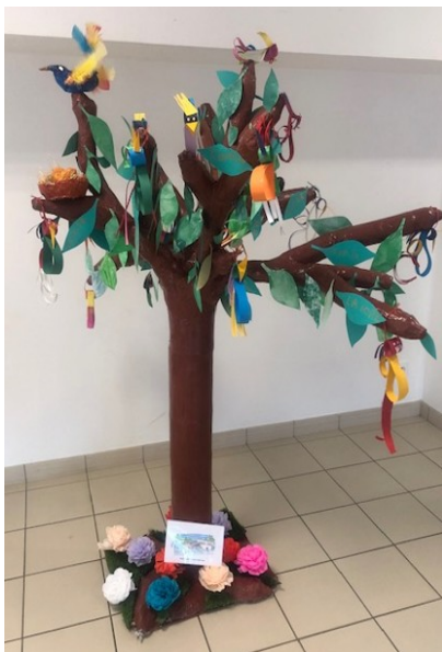
Arbre de la laïcité des Borderies

Le Conseil Citoyen de Crouin a organisé mardi 10 mai un débat autour de la Laïcité. A cette occasion, les travaux des élèves du quartier de Crouin (écoles Victor Hugo et les Borderies) étaient exposés au pavillon des borderies.