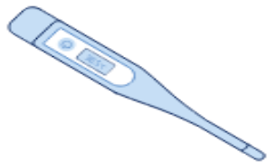
Fièvre > 38°C