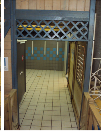
Accès bassin scolaire