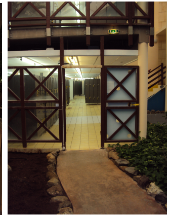
Accès vestiaires publiques