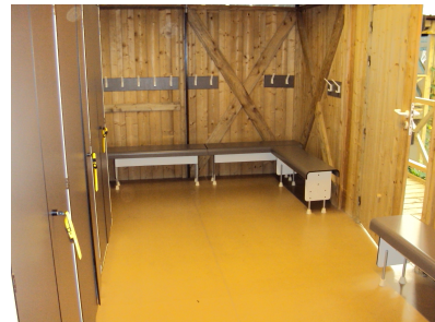
Intérieur des vestiaires