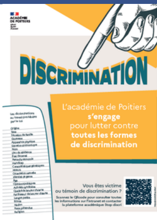
AFFICHE POUR VOTRE ECOLE