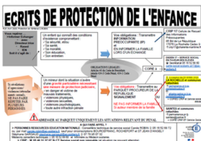
NOUVEAU VISUEL PROTECTION DE L'ENFANCE (AVRIL 2026)