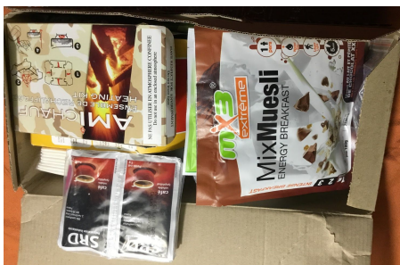
L'intérieur de la ration militaire

Il y avait 2 marsouins qui expliquaient ce que contient les cartons et à quoi ils servent. Dans le carton il y avait deux plats, un pour le midi et l'autre pour le soir, un sac poubelle, une entrée, un dessert, tout pour assaisonner la ration, un energy drink, des biscuits et de la patte à fruit.