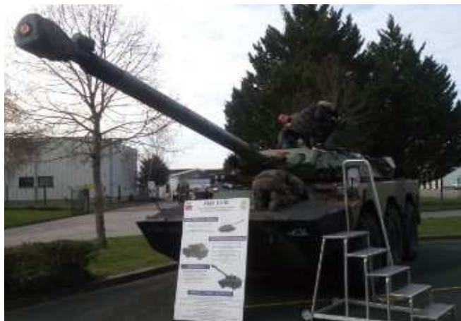
L'AMX-10 RC.

Notre dernière activité a eu lieu dehors, devant le bâtiment du 3 ème escadron. Des marsouins nous ont présenté deux de leurs véhicules : - l'AMX-10 RC est un char léger qui pèse 17 tonnes. Il contient quatre hommes : le chef d'engin, le pilote, le tireur et le chargeur. Il est armé d'un canon de 105 mm et de deux mitrailleuses. Les obus utilisés sont variés : explosifs, perforants, fumigènes ou charges creuses.