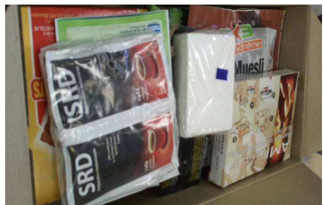
Contenu d'une ration type.

A l'intérieur, il y a divers aliments et ustensiles : du muesli avec du lait déshydraté pour le matin, deux repas à réchauffer pour les déjeuner et le dîner, une cuillère, des allumettes et un objet pour faire cuire. Nous avons chauffé notre plat au bain-marie. C'était très bon mais un peu surprenant.