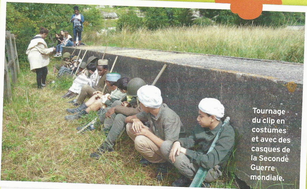
Tournage du clip en costumes et avec des casques de la Seconde Guerre mondiale.