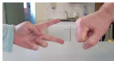
Ici la pierre gagne