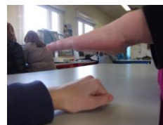
Ici la feuille gagne