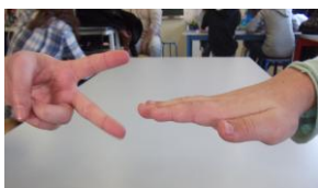
Ici les ciseaux gagnent

Le premier joueur arrivé à ligne médiane (rouge sur le schéma) remporte la partie.