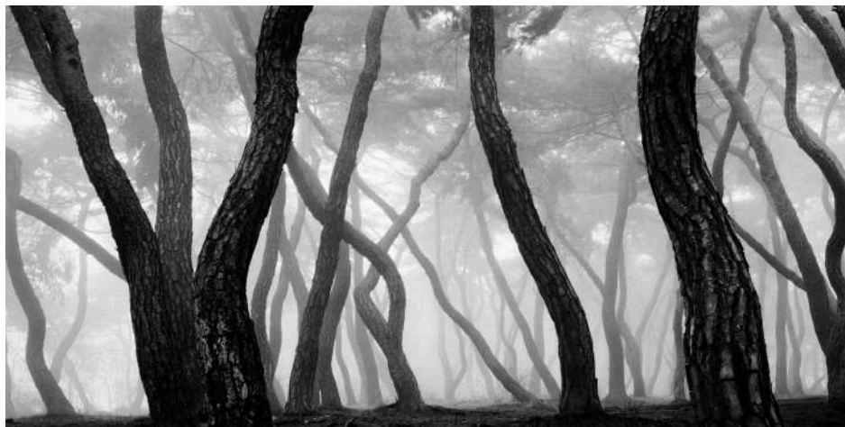
Bae Bien-U - Collection d'art Société Générale

“Que vaut la caresse du vent qui dissémine les graines à travers les plaines ? À combien estime-t-on un coucher de soleil ? Les ressources de la nature ont une valeur, leurs destructions ont un coût, mais pour autant, la nature a-t-elle un prix ?