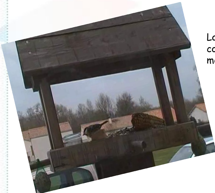
La mangeoire du collège avec une mésange charbonnière