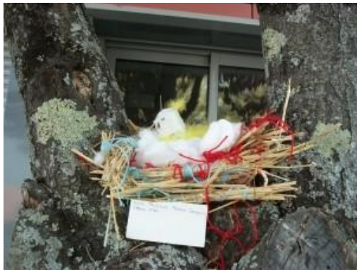
Nid artistique réalisé en Arts Plastiques

Sois le plus imaginatif possible, n'hésite pas à utiliser plusieurs matières. Si tu ne sais pas réaliser ton décor sur cette feuille, envoie-nous une photo de ta réalisation. Tu peux également interviewer un spécialiste en la matière. Retranscris ton interview avec éventuellement des photos à l'appui.