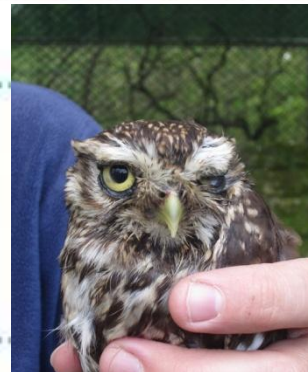
Caractéristiques principales :

Ils pondent 3 à 5 œufs par an. Avant leurs reproduction, ils effectuent une parade nuptiale pendant laquelle ils se passent des proies.