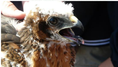
Caractéristiques principales :

Compare ton oiseau avec 3 autres oiseaux et compare-le en fonction des critères suivants : identification des parties du corps, chants, habitat, vol, nidification, etc.