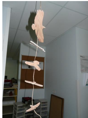
Mobile d'oiseaux en bois réalisé en technologie