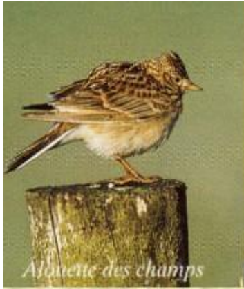
Alouette des champs