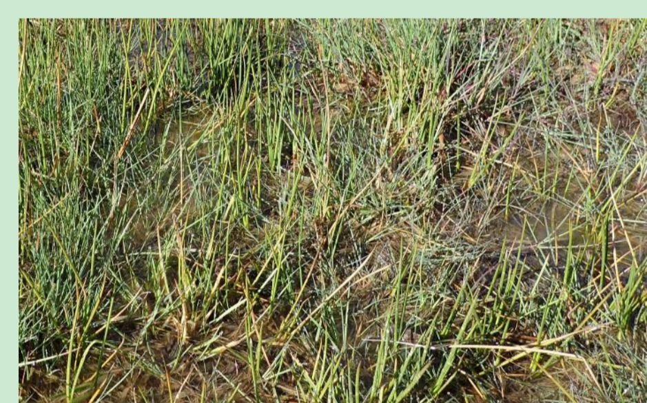
Zone humide à juncs