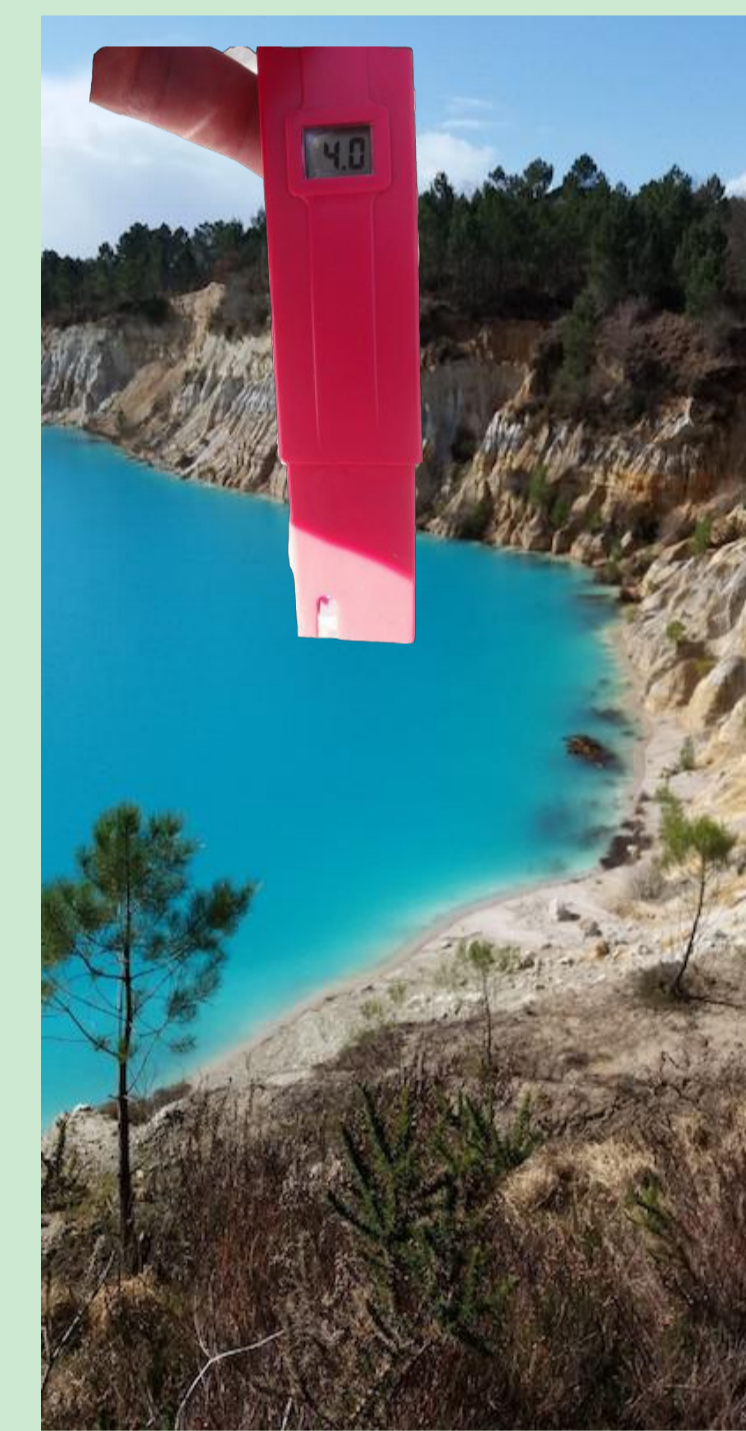
Mesure de pH