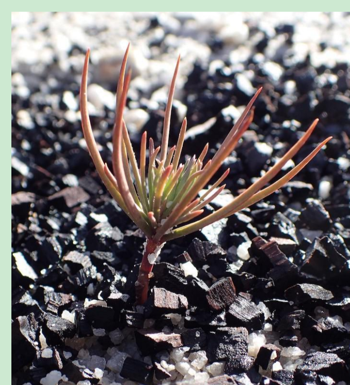
Jeune pin colonisant les remblais