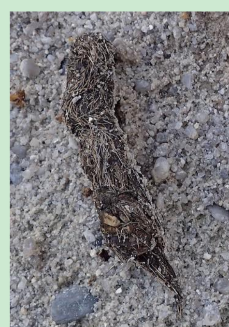
Crotte de renard

Techniques : Observations directes et relevés d'empreintes