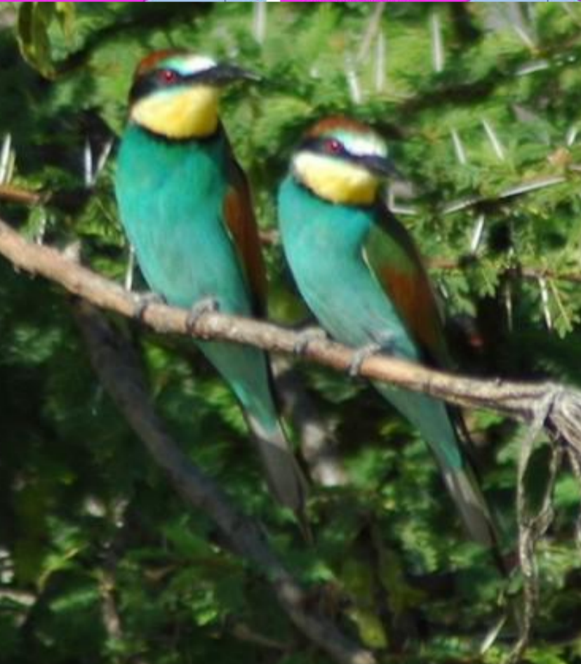
Guépier et son aire de répartition