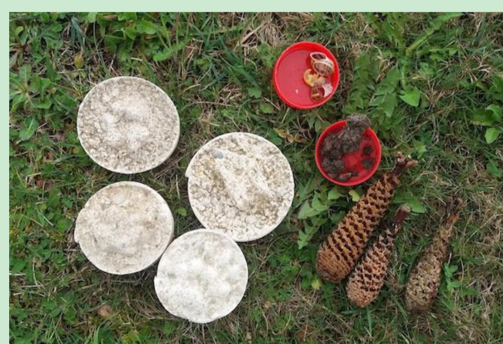
Moulage d'empreintes et indices de présence