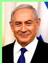
Alors que Benjamin Netanyahu

Législatives en Israël : Netanyahu en tête mais sans majorité, un parti islamique s'invite