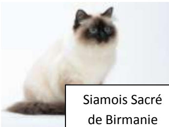
Siamois Sacré de Birmanie