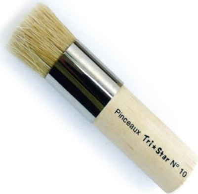
une brosse pour pochoir