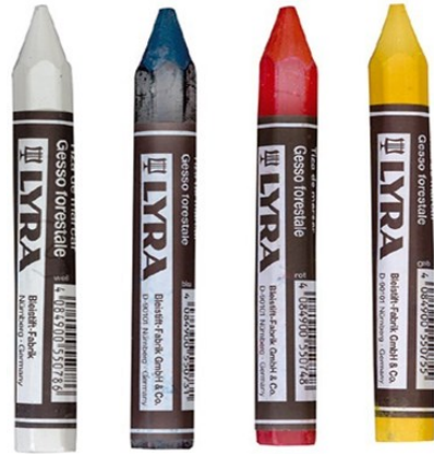
des craies grasses