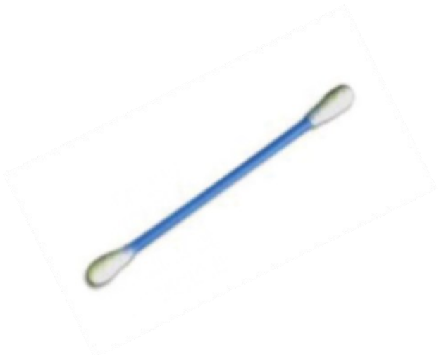
un coton tige