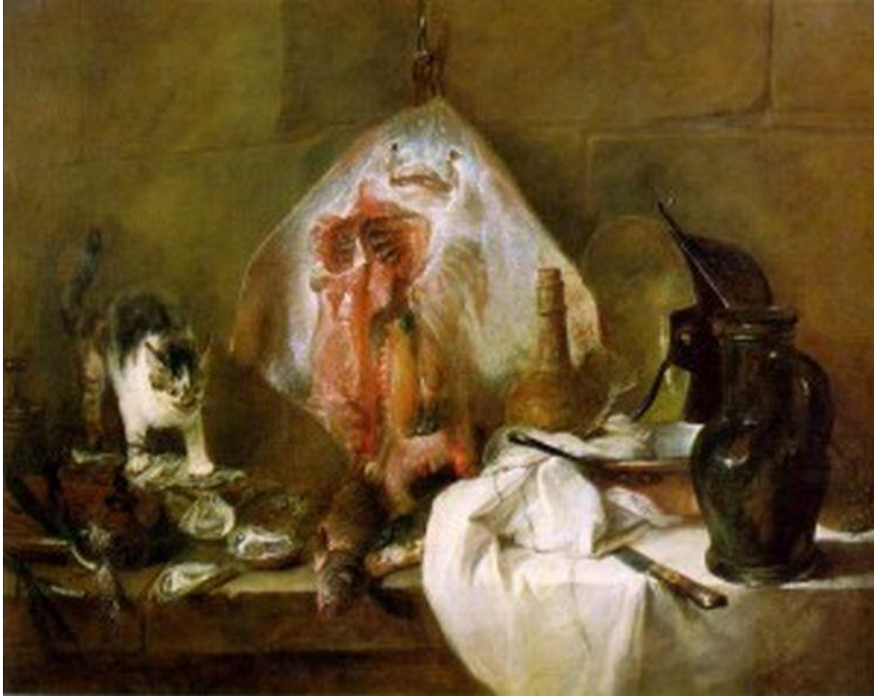
Jean Siméon Chardin La raie, 1728 114X146cm huile sur toile, Musée du Louvre