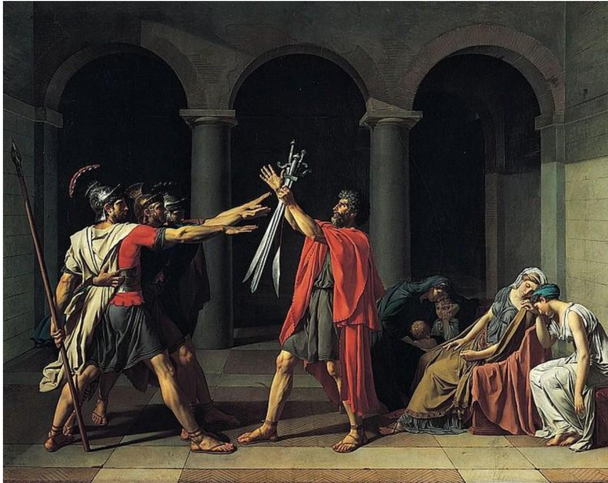
Jacques-louis David Le serment des Horaces, 1784-1785 huile, 330X425 cm, Musée du Louvre