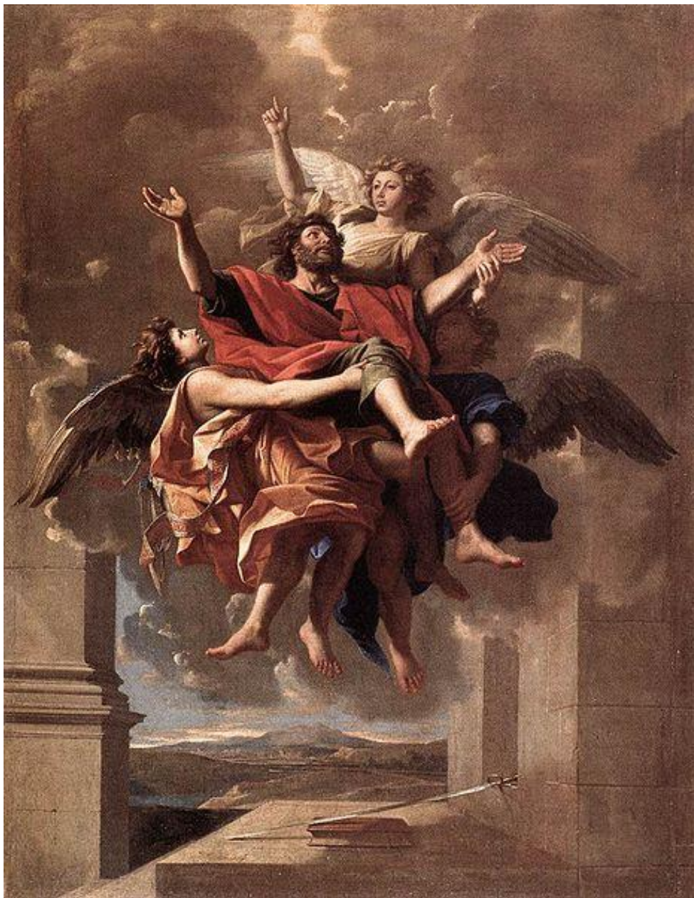
Nicolas Poussin (1594-1665) L'extase de Saint-paul, 1649-1650 148X120cm, huile sur toile Musée du Louvre