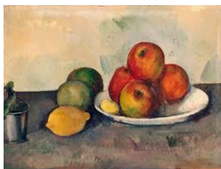
Paul Cézanne « Nature morte aux pommes »