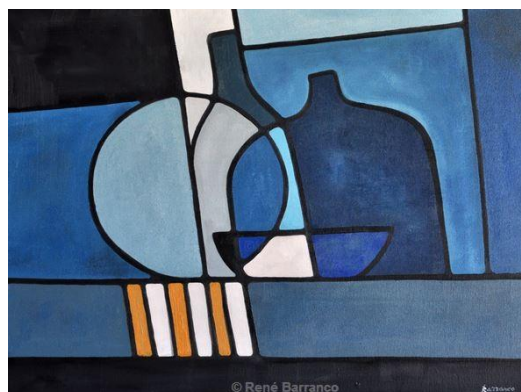
René Barranco « Transparence »