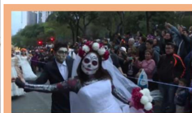
Fête des morts : les "Catrinas" s'emparent des rues de Mexico, France Info

Le dessin animé Coco montre très bien comment se prépare cette fête. Nous avons regardé un passage en classe (21 premières minutes).