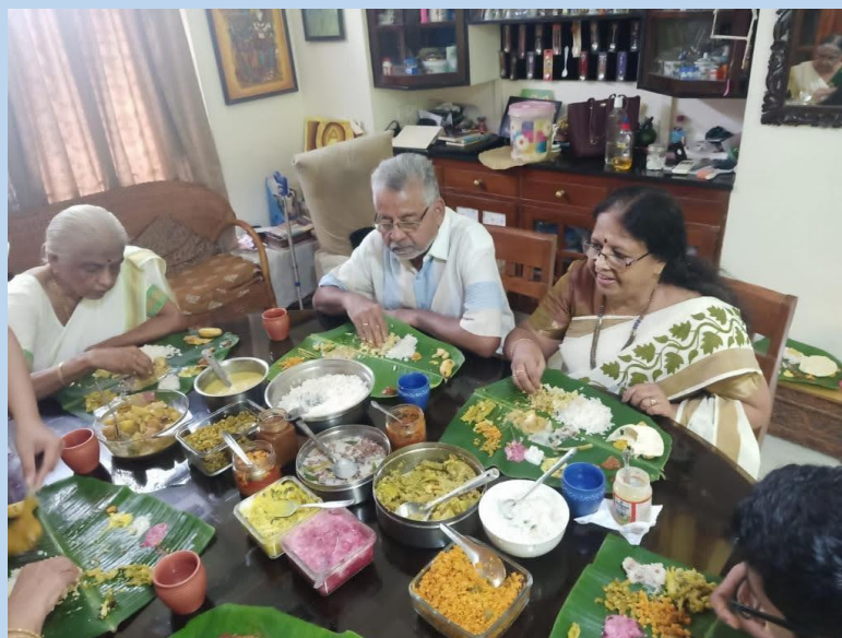
Une famille du Kérala (Trivandrum) durant la fête d' Onam.