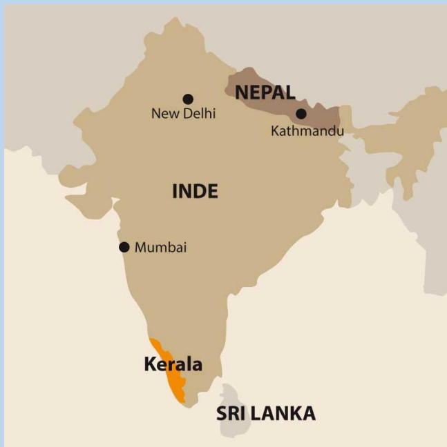
Carte de l'Inde avec la région du Kerala