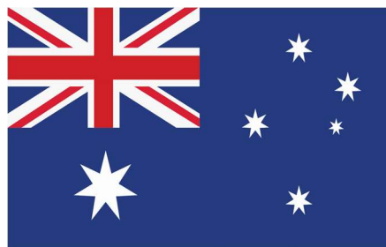
Le drapeau Australien