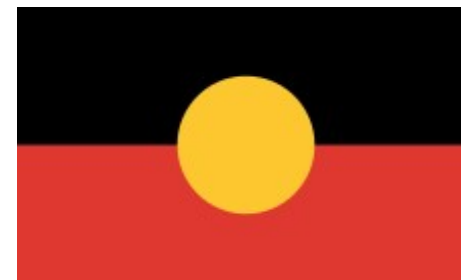
Le drapeau des aborigènes d'Australie