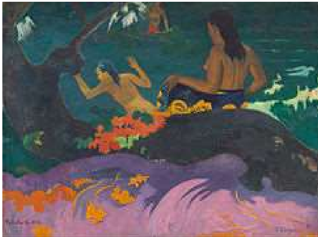
Fatata te miti