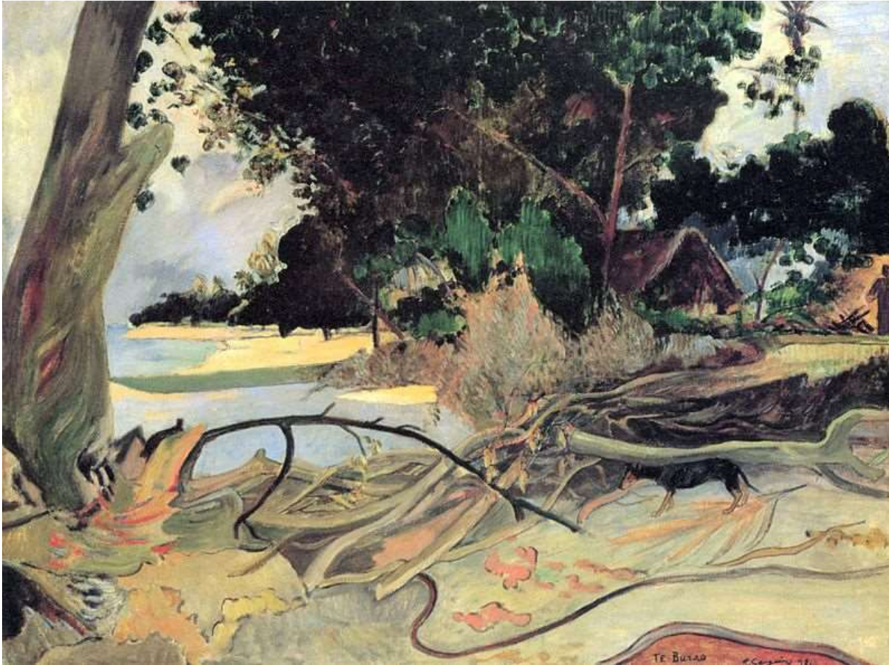
Le gros arbre