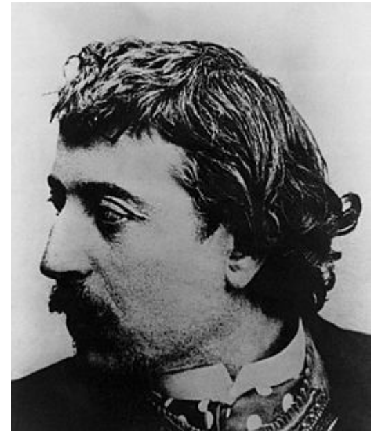
Paul GAUGUIN (1848–1903)