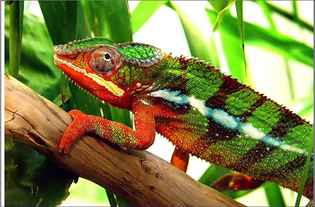
Et les caméléons vus par des artistes :