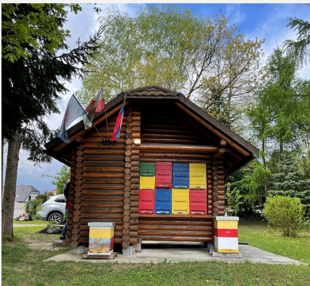
Un rucher près d'une école à Sentjur, près de la ville de Celje. On trouve des ruchers comme celui-ci partout dans le pays.