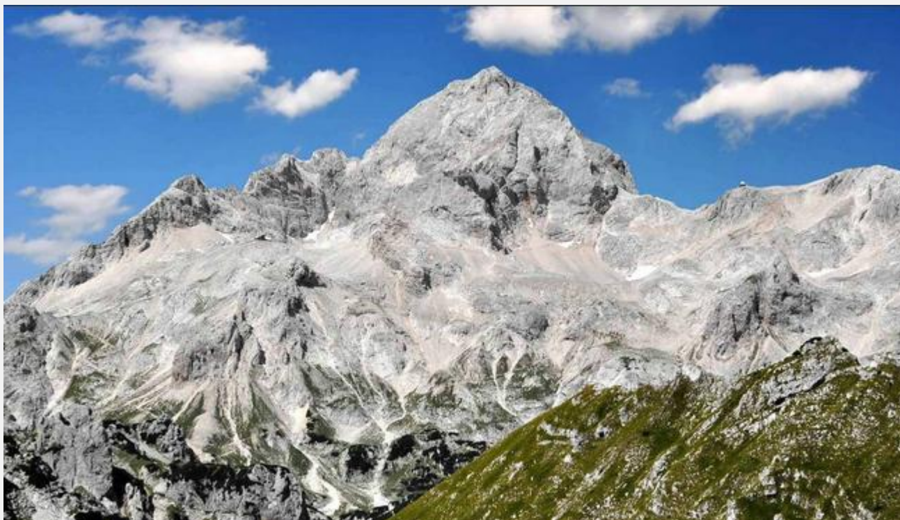
Le sommet le plus haut de Slovénie : le Triglav qui se trouve au Nord-Ouest du pays et qui culmine à 2864 mètres.