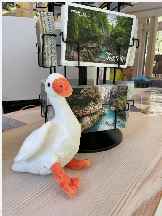
Les gorges de Vintgar