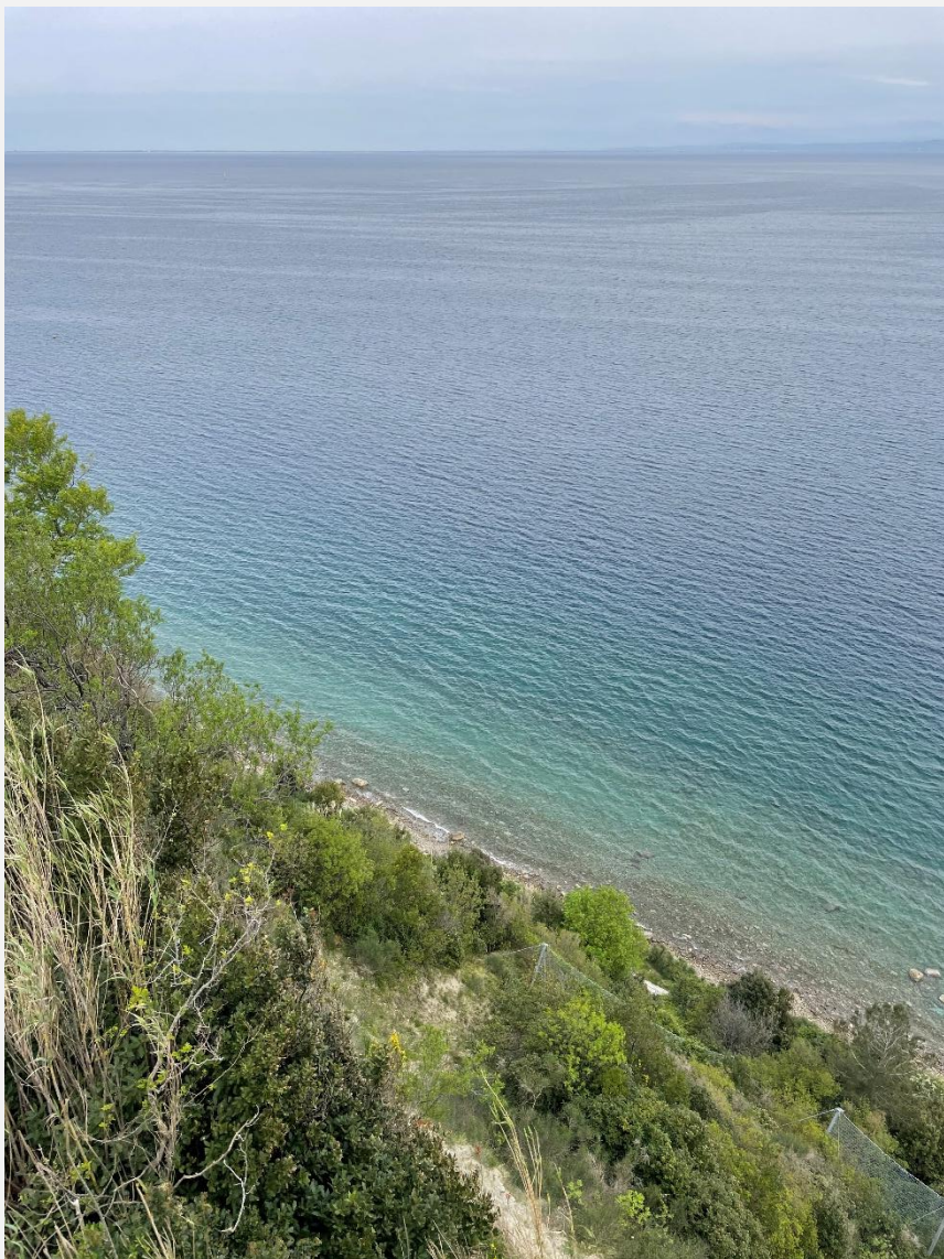
La mer Adriatique à Piran