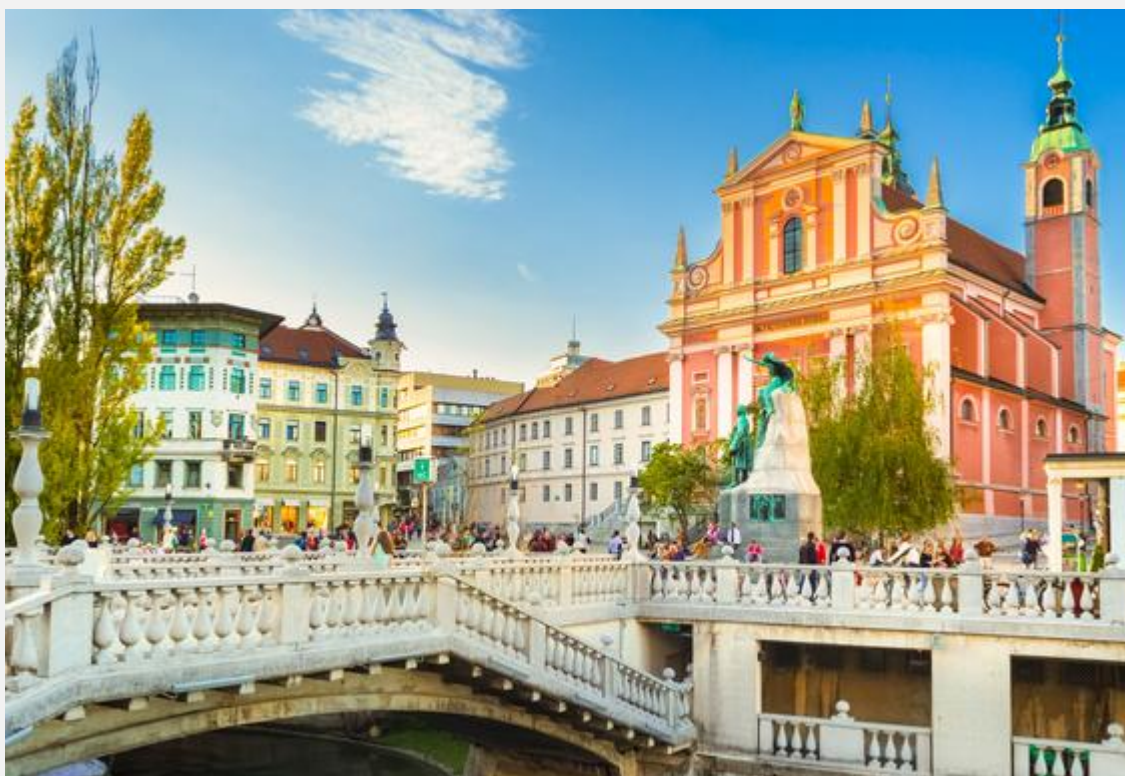
La capitale Ljubljana