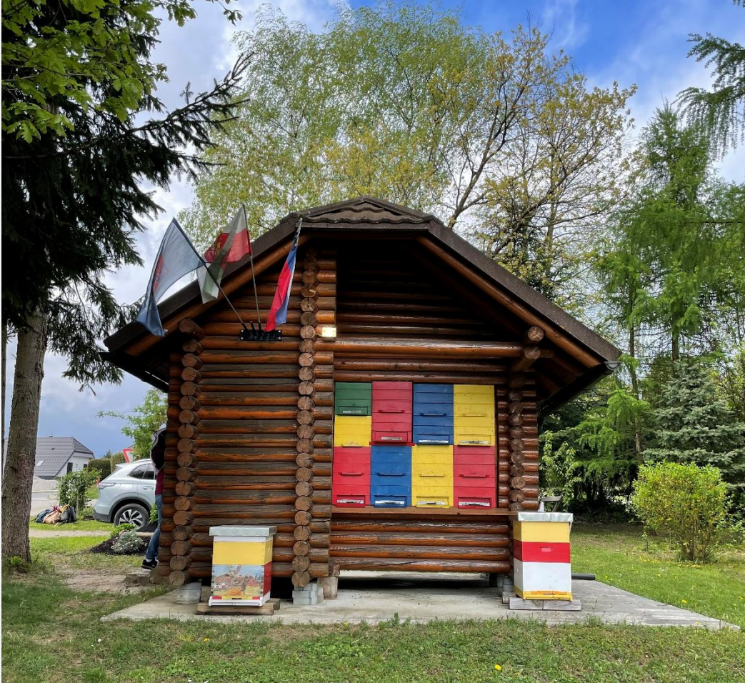
Un rucher près d'une école à Sentjur, près de la ville de Celje