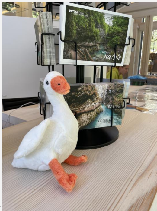
Les gorges de Vintgar