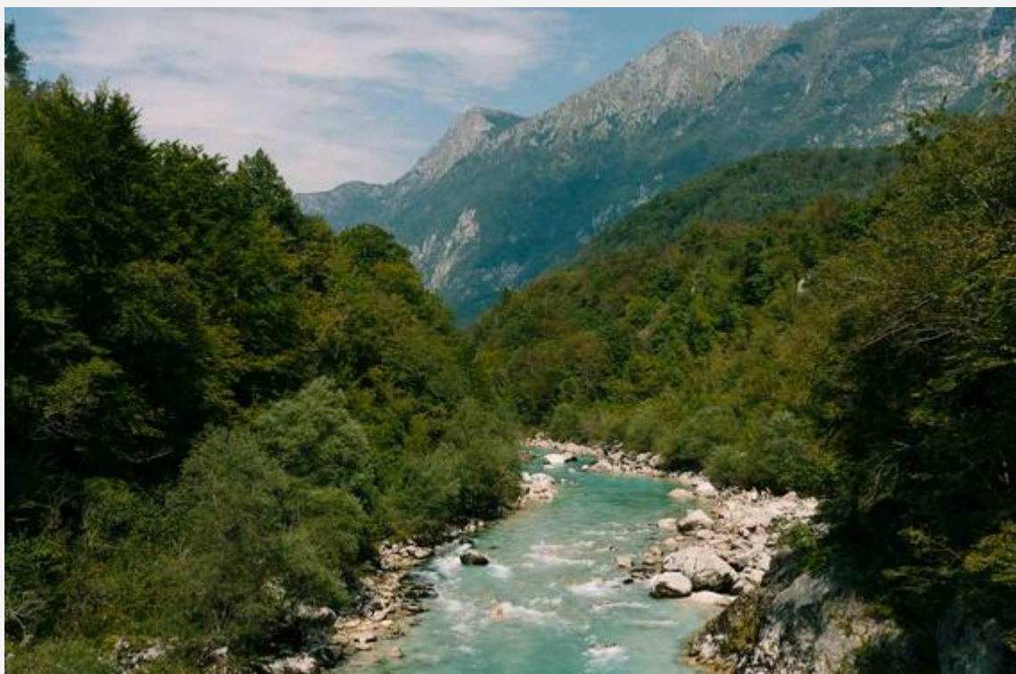
La rivière Soca, avec ses eaux turquoise

La campagne slovène vallonnée et verte. Les petites églises se trouvent souvent au sommet de petits monts.