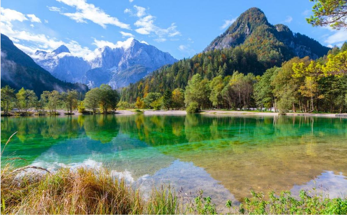
LE LAC DE Kranjska Gora et le lac de BLED, entourés de montagnes, dans le parc du Triglav (plus haut sommet de Slovénie)