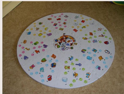
Le Lynx, Educa Boras

Par exemple, le jeu du lynx et le jeu des petits chevaux peuvent être laissés à disposition sans consigne précise.