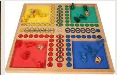
Les petits chevaux