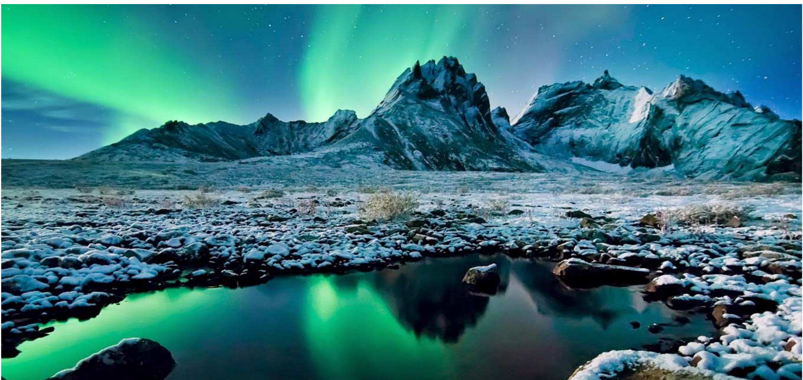
( http://bingfotos.blogspot.fr/2015/01/aurora-borealis-over-tombstone.html )