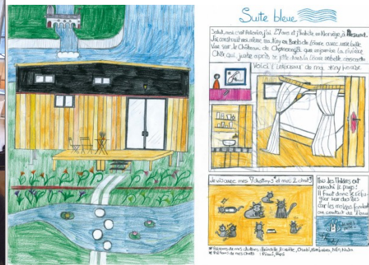
Exemple 2 de BD