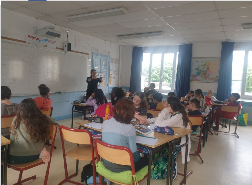
Intervention pour la création d'une BD autour de l'habitat

Bilan de l'année et prolongements (en quoi ce projet va permettre la mise en œuvre pérenne d'actions en faveur de l'environnement) :