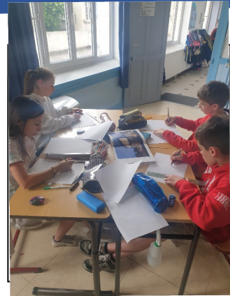
Élèves en train de construire leur BD

Nous avons ensuite réalisé un petit livret pour tous les élèves.