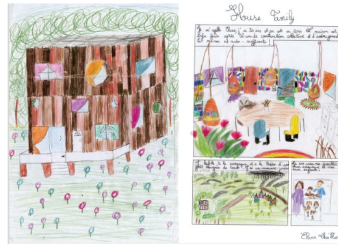
Exemple de maison réalisée par un élève