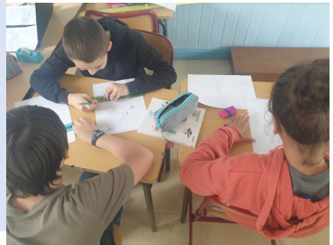
Elève en train de construire leur BD

Bilan : très concret pour les élèves sur le mieux consommer autour du matériel scolaire (trousse). Différence entre besoin et envie.