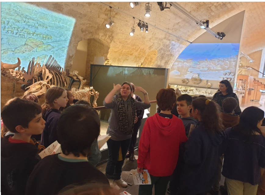
Visite du musée d'Angoulême : Partie préhistoire et Moyen Age