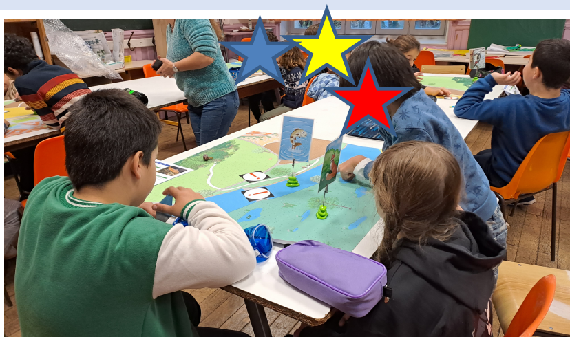
J2 Identifier les dangers et chercher des solutions pour que la truite remonte le fleuve malgré un barrage.