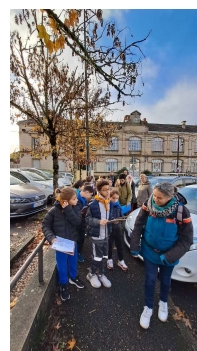
J1 Découverte du quartier à la recherche des animaux : merle, hérisson...