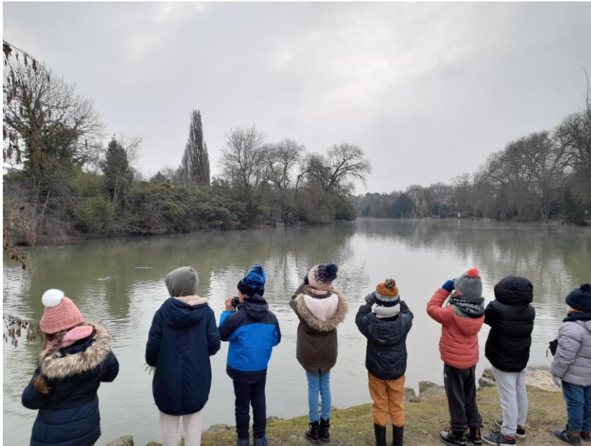
Observation à l'aide de jumelles