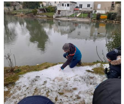
Observation d'empreintes dans la neige