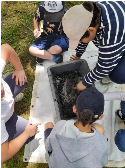
Pêche de petites bêtes à l'aide d'épuisettes

Bilan de l'année et prolongements : ce projet a tout d'abord permis aux élèves d'acquérir des connaissances spécifiques sur les animaux et végétaux autour et dans la Touvre. Les élèves, ayant été sensibilisés à cette biodiversité, sont désormais plus observateurs lorsque nous sortons de l'enceinte de l'école .