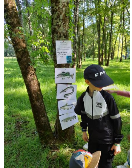
Atelier de reconnaissance des poissons