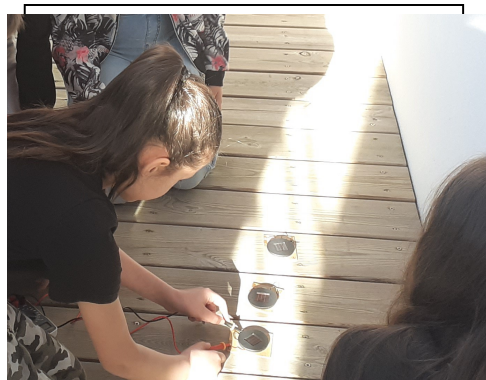
La production d'énergie solaire

Par l'intermédiaire de différents ateliers et différentes visites, les enfants ont pris conscience de la consommation d'énergie et de ses conséquences.