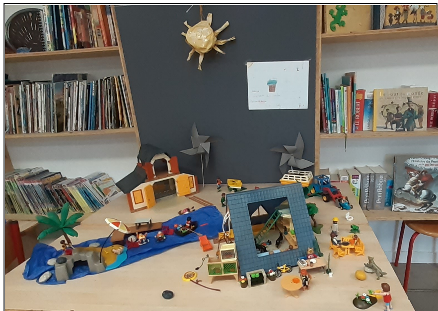
Le monde des énergies renouvelables