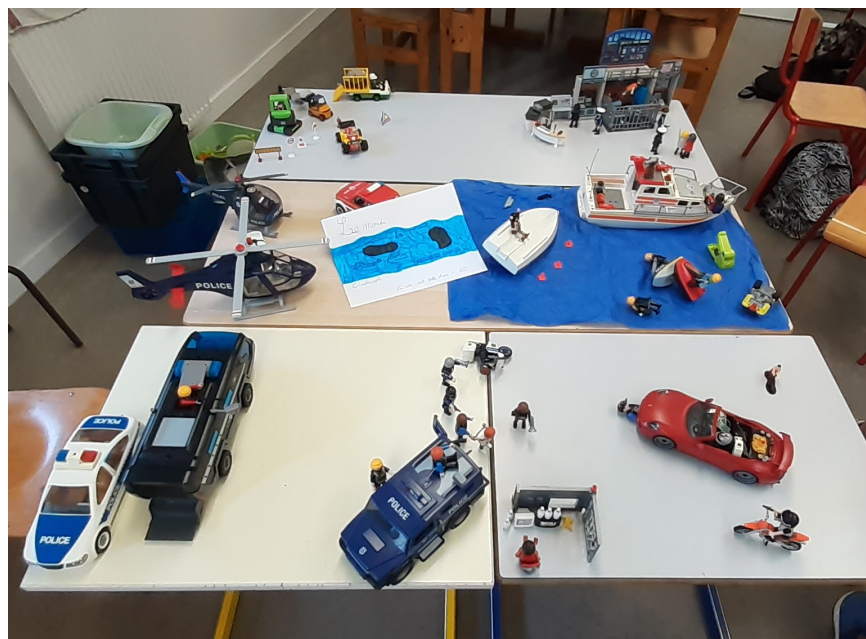
Le monde des énergies fossiles