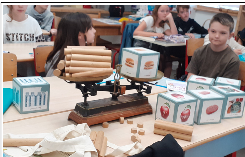
Le bilan carbone du hamburger...incroyable !!!!