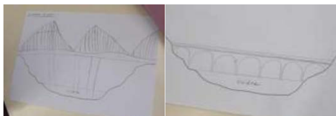
Exemples de productions d'élèves au Cycle 2