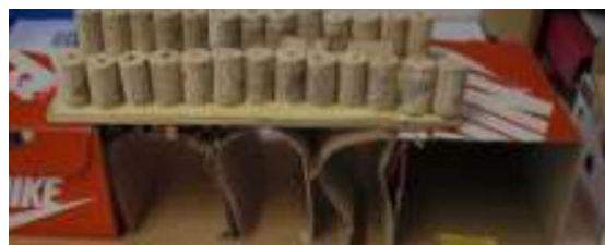
Exemples de productions d'élèves au Cycle 2