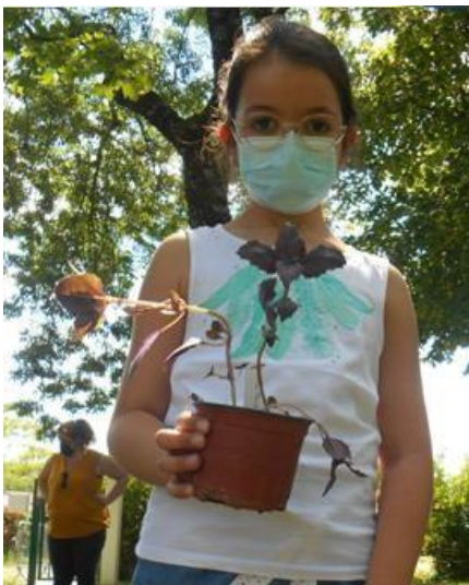
Nada avec un pied de basilic pourpre (il y en a aussi un vert)