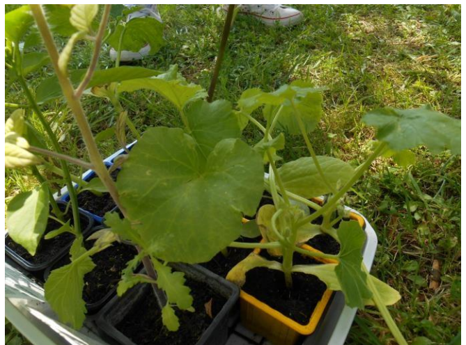
Les pieds de potiron et de courgette