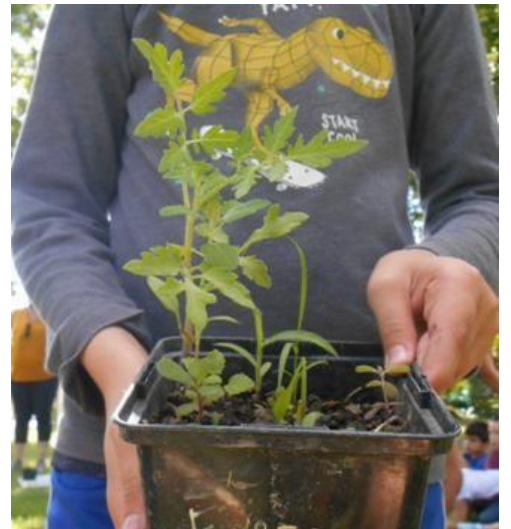
Un pied de tomate