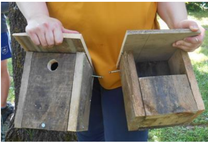
Les 2 nichoirs