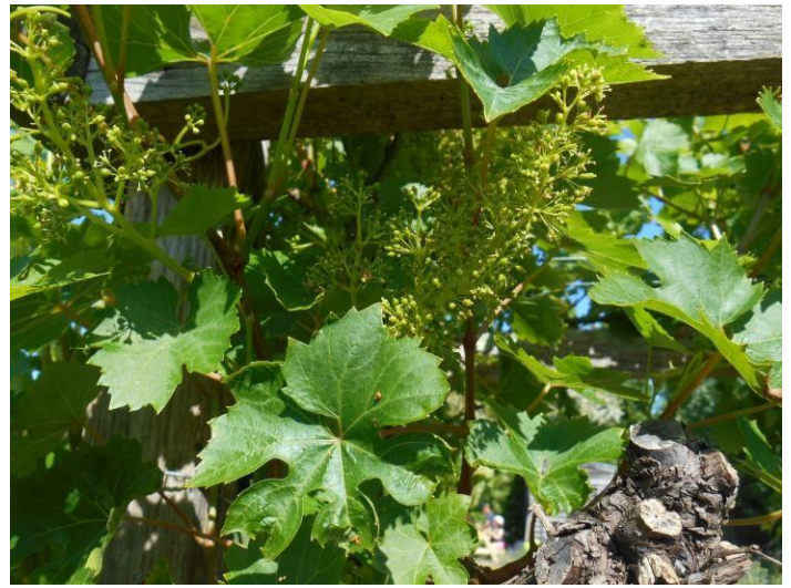
Des grappes de raisin