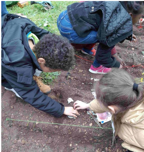
Jour de semis de légumes et de fleurs dans le jardin potager de notre école.