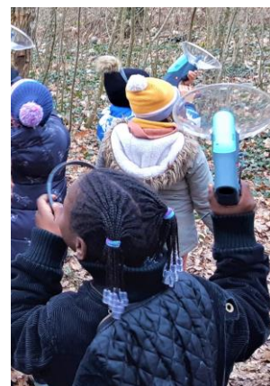
1 ère séance : Les enfants sont allés dans le bois près de l'école pour écouter les chants d'oiseaux avec des amplificateurs de sons.