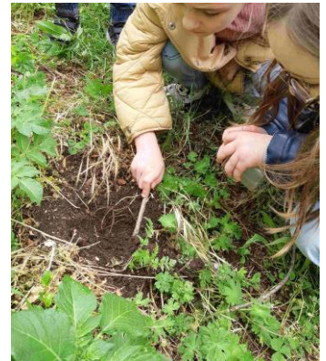
3 ème séance : A la recherche des petites bêtes du jardin...