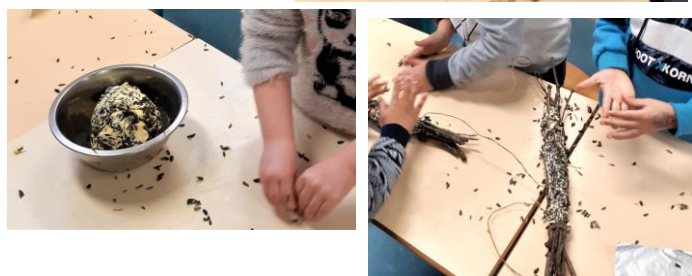
1 ère séance: Fabrication d'un nichoir et de mangeoires pour attirer les oiseaux dans notre jardin.