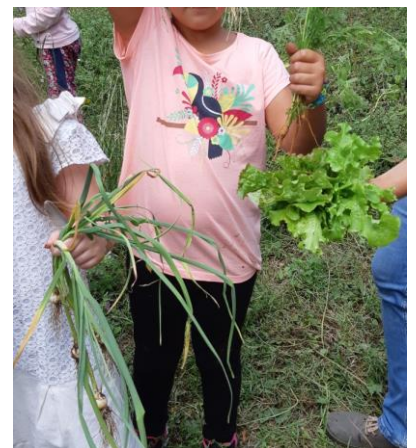
Dernière séance : récolte de quelques légumes de saison puis dégustation.

Ce projet a permis tout d'abord de faire prendre conscience aux enfants de l'existence et de la diversité des êtres vivants qui les entourent. Ils ont également appris à les observer pour mieux les connaître, et mieux les protéger. Il a suscité l'envie de continuer à jardiner et à faire pousser des légumes à l'école, et même chez soi. Pour notre école, c'est un tremplin vers la création d'un jardin potager à long terme.