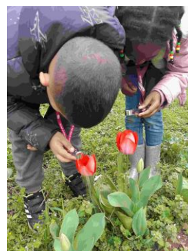
2 ème séance : Les élèves ont pu observer à la loupe le pistil, les étamines et le pollen des fleurs.