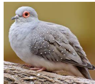
La tourterelle :