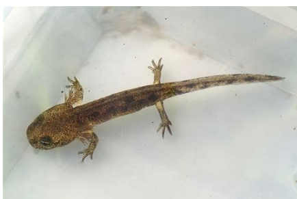
Les têtards :

Ce sont des têtards de triton ou de salamandre.