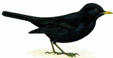
Le merle :