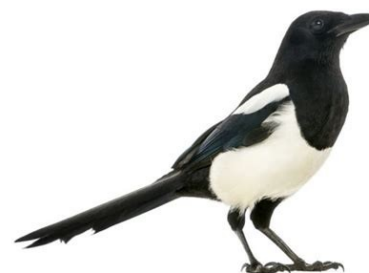
La pie :