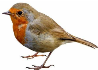
Le rouge gorge :