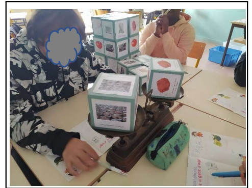
Le poids de nos choix de consommation sur la planète