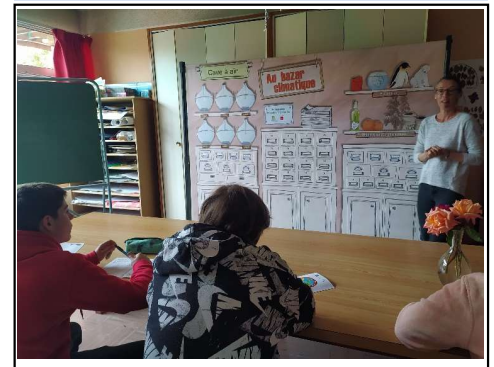
Le cycle de vie des produits de la vie quotidienne