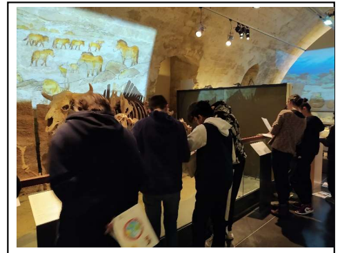
Visite au musée