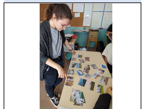
Animation besoins et impacts

Ce projet a également permis de remettre en cause certaines idées reçues et aura peut-être permis de modifier certains comportements.