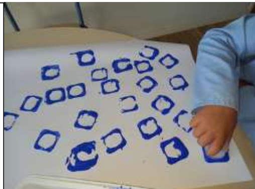
Empreintes de déchets