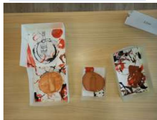
Une collection d'objets

La thématique des déchets restera au centre de nos préoccupations car la question du tri doit encore être travaillée. Nous allons également réfléchir à la réduction des déchets et élargir les pratiques déjà en place (compost, emballages réutilisables, ...).