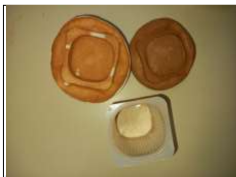
Empreintes dans l'argile et moulages de plâtre

Bilan de l'année et prolongements (en quoi ce projet va permettre la mise en œuvre pérenne d'actions en faveur de l'environnement) :