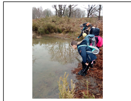
Observation des œufs de grenouille dans une mare des Brandes à la fin du mois de février