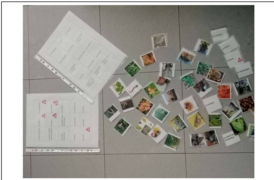
Jeu de loto / memory des plantes et animaux rencontrés dans le bois de Soyaux