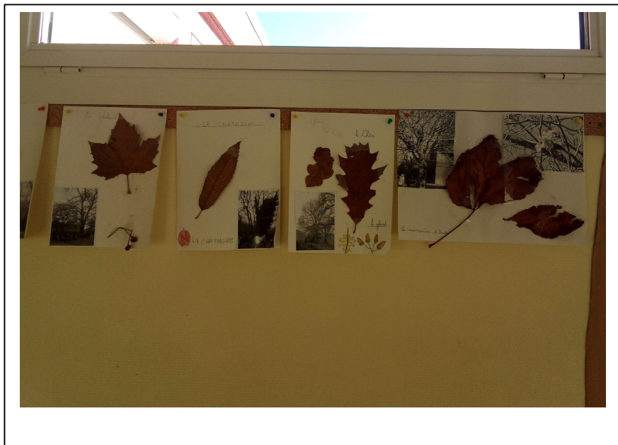
Quelques fiches sur les arbres observés : érable, châtaignier, chêne, marronnier