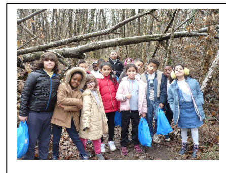
La classe en sortie de prélèvement d'éléments dans la forêt d'automne