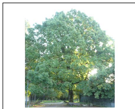
Le grand chêne de l'entrée du bois de Soyaux