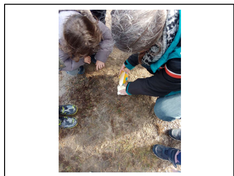
Un moulage en plâtre d'une empreinte de chevreuil