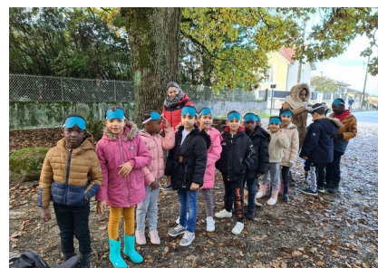
La première sortie dans les bois : les élèves vont se bander les yeux avant d'entrer dans le bois.

Sortie dans les bois de Soyaux et travail sur les arbres, les animaux qui y habitent (recherche d'indices et d'empreintes), comprendre la chaîne alimentaire.