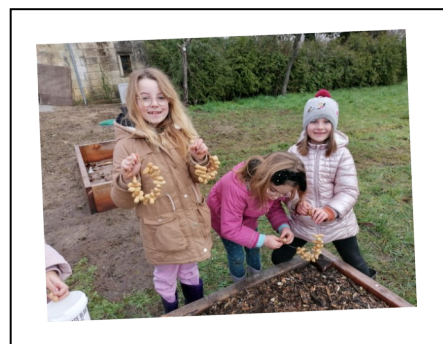
Fabrication de mangeoires pour les oiseaux en hiver.