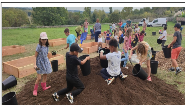
Fabrication de nos bacs potagers en lasagnes En septembre